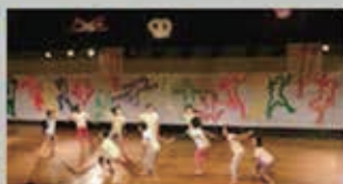
写真: 過去のパフォーマンスキッズ・ トーキョー舞台作品より。